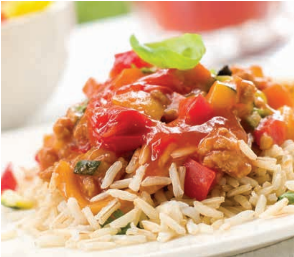
Рис со свинойной по-сербски