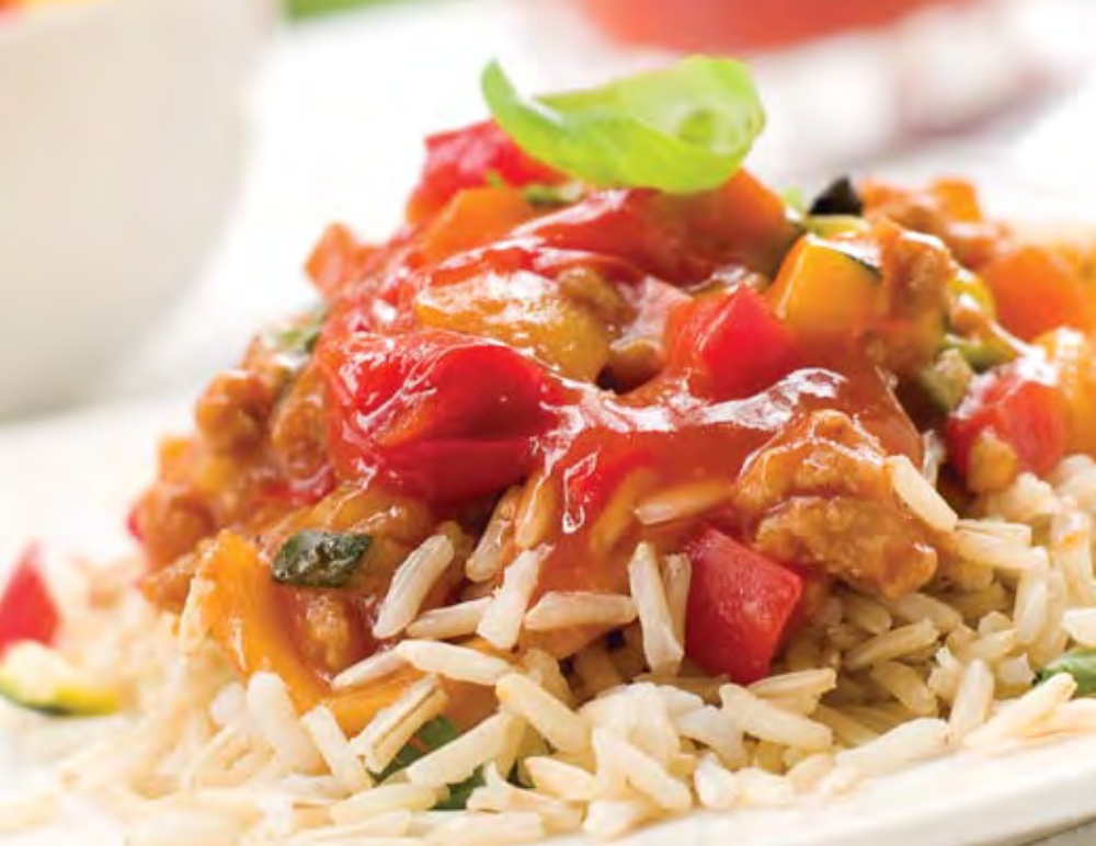
Рис со свинойной по-сербски